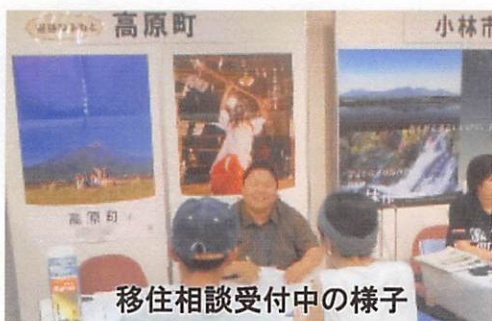
移住相談受付中の様子